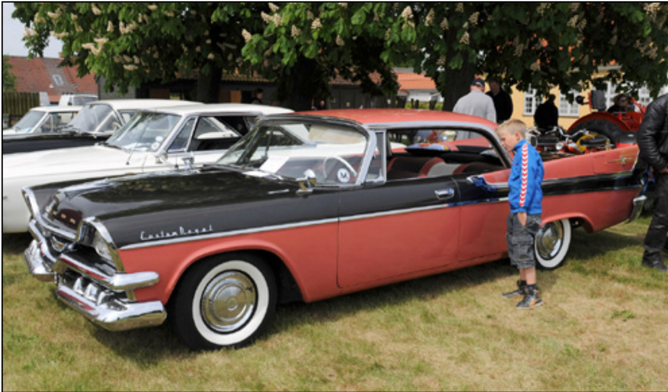
Der bliver nu i lovgivningen taget mere hensyn til veterankøretøjer. Fotoet her er fra et træf for de gamle biler i Kong.